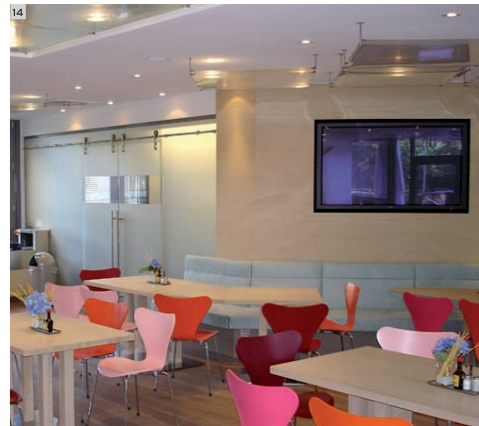
56 POS-Ladenbauer ■ 5 • 2006