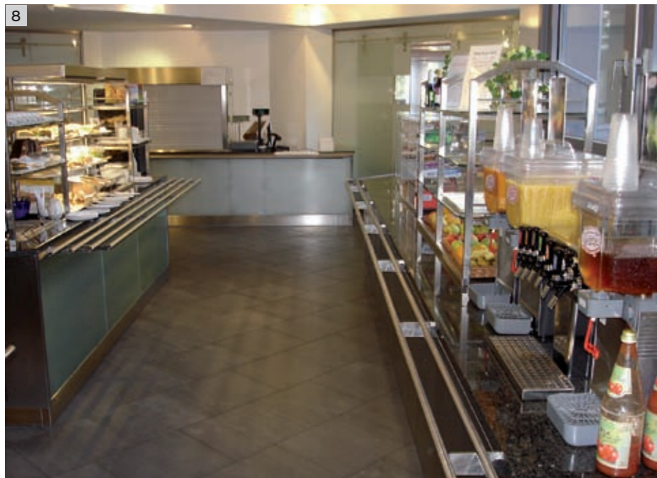
8 Reichhaltige Angebotspalette