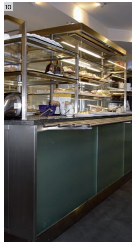
56 POS-Ladenbauer ■ 5 • 2006

Der Gast fühlt sich hier wohl und kann in diesem äußerst hellen Raumambiente seine Gedanken baumeln lassen und dabei genüsslich auf die Terrasse blicken. Daneben sind alle anderen vorhandenen großen Fensterfronten jedoch unverändert geblieben „und wurden bei der Konzeption der Bestuhlung mit vorgesetzten, modernen Sitzbänken aufgenommen. Alle ursprünglichen Fensterdekorationen wurden ebenfalls durch transparente Schiebeforhänge und schallabsorbierende durchsichtige Folienpaneele ersetzt,“ ergänzt Hans Kumpf.