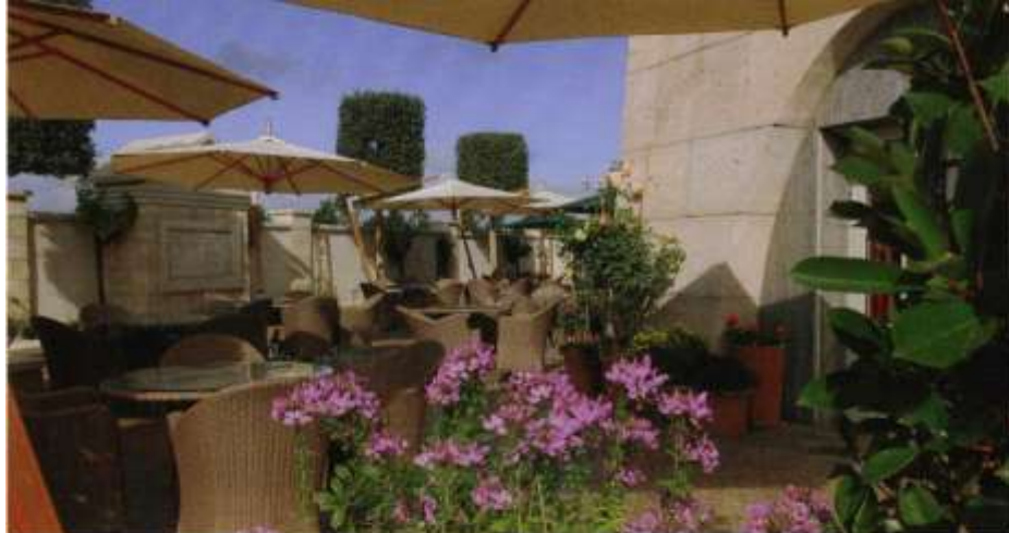
Der Klostersgarten ist durch hohe Mauern lärm- und sichtigeschützt