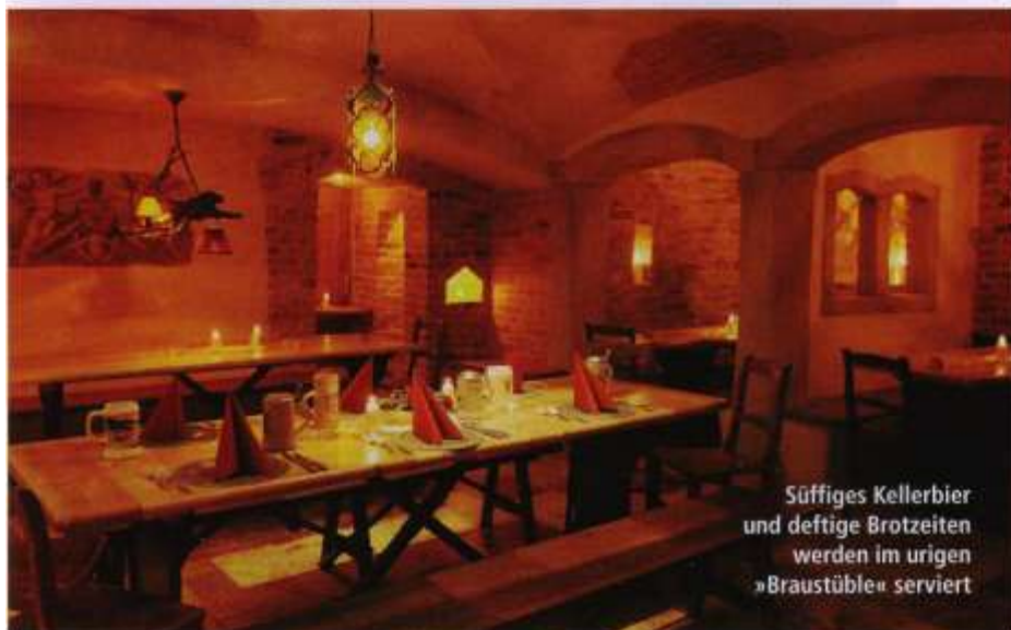
Süffiges Kellerbier und deftige Brotzeiten werden im urigen »Braustüble« serviert

klimatisierte Logisbereich auf die ersten vier Etagen verteilt, befindet sich im Erdgeschoss neben der Rezeption und den Tagungsräumen die St. Jakobus-Kapelle mit einem antiken Originalaltar aus Portugal, in der auch Trauungen und Taufen stattfinden können. Darüber hinaus gibt es einen liebevoll, mit aufwendigen Wandmalereien gestalteten Poolbereich, der einen kleinen Innenpool mit kupferner Regendusche und ein 200 Quadratmeter großes Außenbecken umfasst. Witziges Detail in der Lobby: Der EC-Automat ist in einen alten Beichtstuhl integriert.