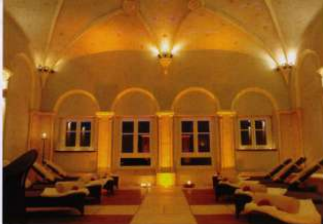
Das verpachtete Wellnessareal in der obersten fünften Etage sorgt auf 500 Quadratmetern für Entspannung pur

Für die bauliche Anbindung des neuen Domizils an die drei anderen Objekte musste ein Parkplatz verlegt werden. Das 20 Meter hohe Gebäude umschließt einen Bruttorauminhalt von mehr als 25 000 Kubikmetern und bietet eine Gesamtnutzfläche von 6530 Quadratmetern. Während sich der komplett