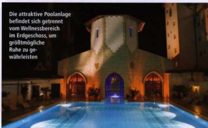
Die attraktive Poolanlage befindet sich getrennt vom Wellnessbereich im Erdgeschoss, um größtmögliche Ruhe zu gewährleisten