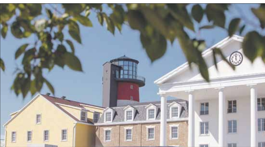
Neuengland in Südbaden: Ab Juli können sich die Besucher im neuen Erlebnishotel Bell Rock auf die Spuren der Pilgerväter und Entdecker begeben.

Martin Neumeier: Das heißt, wir haben zunächst intensiv an der Inszenierung eines Themas gearbeitet und nach einem Ansatz gesucht, der nachhaltig tragfähig ist und auch eine spannende Geschichte in sich trägt. Das Konzept musste in den Gesamtkontext Europa-Park passen und sollte zugleich etwas ganz außergewöhnliches Neues sein. Dabei mussten wir anfangs einige Haken schlagen, aber das hat sich letztlich gelohnt.