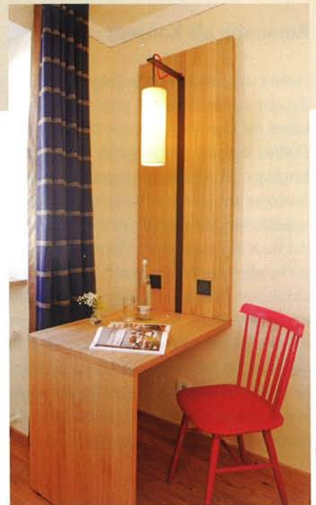
Ob nun Bockskraut oder nicht: Ein Blumengruß auf dem individuell gefertigten Schreibtisch erfreut jeden.