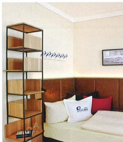
Paneele und praktische Ablagemöglichkeiten schaffen eine wohlige Atmosphäre. Der Stich an der Wand zeigt Historisches – mit blauem Geißbock.