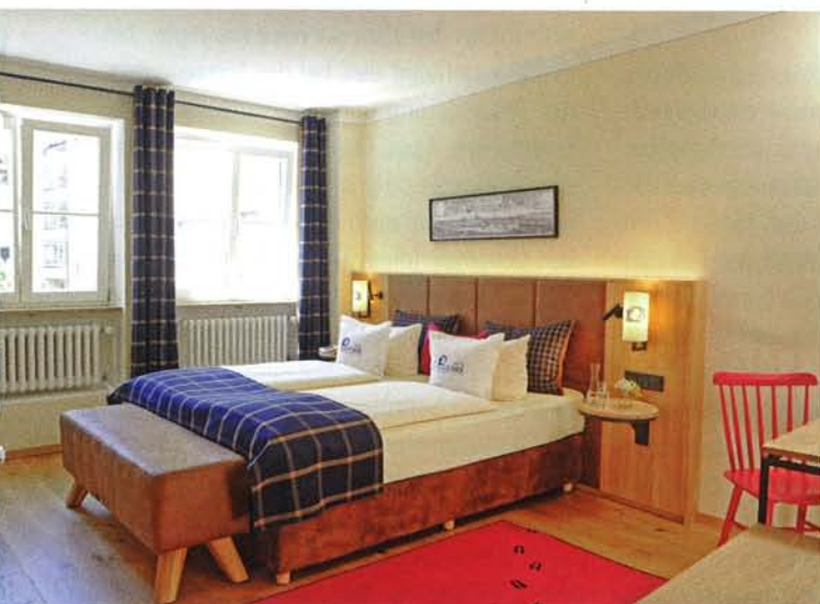
Der Name ist Programm: Lederbock und Spuren auf dem Teppich gehören dazu.