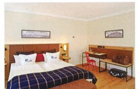
Passende Tische, die Farben Rot und Blau sowie angenehme Beleuchtung prägen die Einrichtung der neu gestalteten Zimmer.