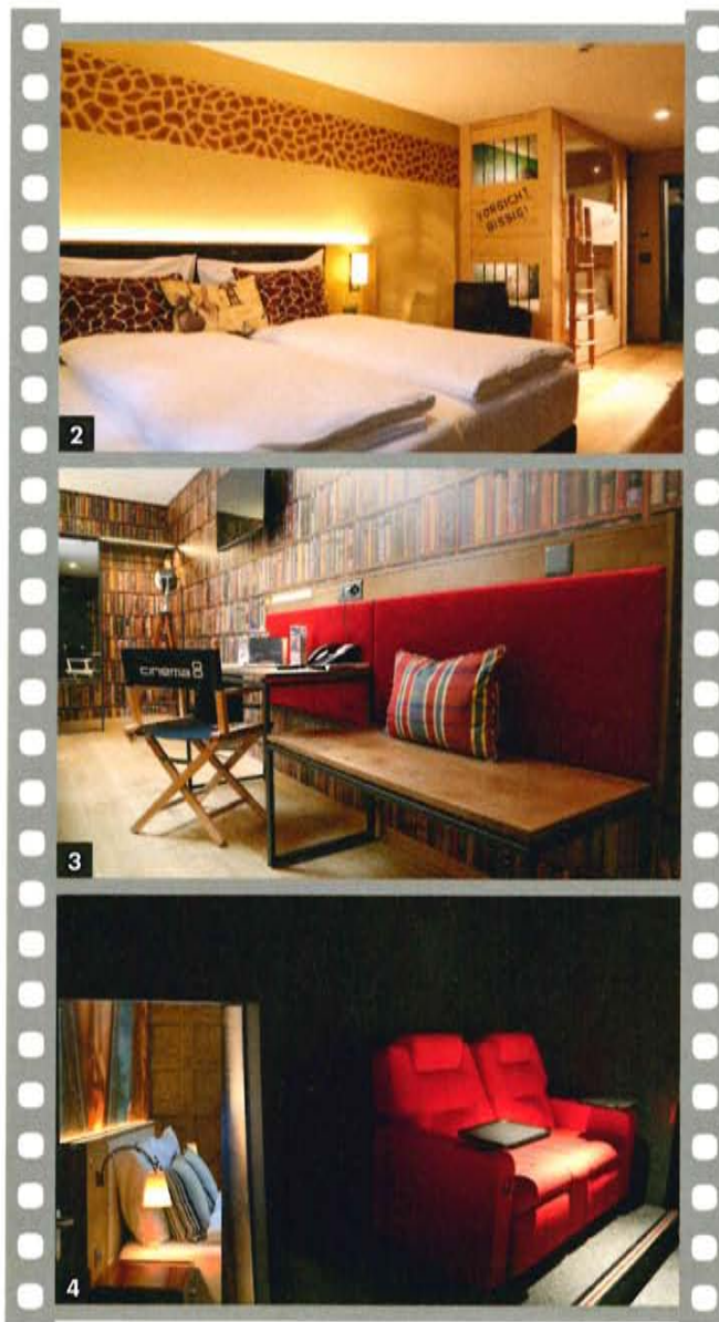
1 Kino ist auch das Motto für die Einrichtung des Hotelbereichs.

In dem Hotelzimmer, das den Eindruck vermittelt, Harry Potter wäre ein