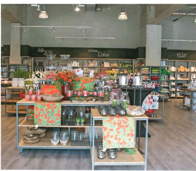
Blick vom Eingangsbereich in das 500 m 2 große Geschäft – an den Rückwänden der graue Streifen für Beschriftungen.